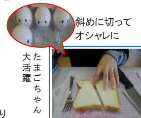
斜めに切ってオシャレに