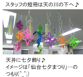
スタッフの短冊は天の川の下へ♪