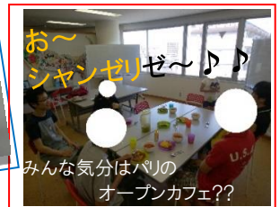
みんな気分はパリのオープンカフェ??