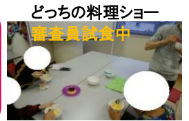
どっちの料理ショー 審査員試食中