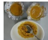
膨らまなかった希望(笑)

◆昔ながらの駄菓子カルメ焼き...のはずが◆(男子1名、女子2名)。始まる前に、理系スタッフで試作。結果...全く膨らまず(「ロロ」)〜幾つか仮説を立てつつ施行錯誤の末、即日リベンジは諦め、カルメカ...ルメ...カラメル!! そうだ、プリンを作ろう(*oωo)ノ「え、プリンって作れるの?」と子ども達。「やってみる?(「ー」ニヤリ)。安心して下さい、できました!子ども達もおいしいといって完食!!ただ、プッチンプリンとどっちの料理ショーをして、どちらに軍配が上がったかはお想像にお任せします。次回7月21日は『アイスクリームを作ろう♪』(o..o..o)♡