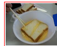
30分くらいかけて ゆっくりしみ込ませます