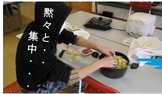
なかなかの アート作品!!

子ども2名(男子2名)。子どものリクエストに応え、当初の予定を変更して鍋。豚肉と白菜を食べやすい大きさに切って、一つ一つ交互に重ねていきました。最初は慣れない手つきで作業をしていた子も、気づけば作業に没頭。大きさが揃うように丁寧に作ってくれました。鍋の締めには白衣の子ども支援員特製のおじや(,,••••,,)ゴクツ。いつもより満腹な会になりました。本当はもっと参加者が多かったのですが、インフルエンザの影響で参加者減(。;△?)。みなさん、おいしいものを食べて、しっかり寝て、体調を崩さないようにしてくださいね。