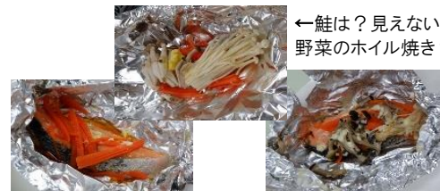
←鮭は?見えないだけ? 野菜のホイル焼き?