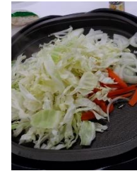
いい匂いが漂ってきそうです♪