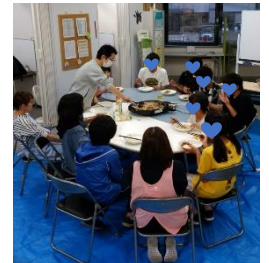
あっという間に完食!