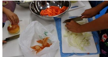
たっぷり野菜を入れました

女子5名、男子5名が参加。常に肉が食べたいとリクエストもあるので、今回は食べたことない子も多い羊肉を体験してもらおうとジンギスカンに挑戦。半数以上の子どもがクサイから嫌、羊は嫌だ!と開催前からブーイング🐏でした「食べない(-_-)」と連呼していた小学生達も、タレに漬け込んだ肉が焼ける匂いが漂うと、我先にご飯をよそって、おかわり。部活を引退した中3男子4名が参加していたこともあり、15人前の肉と6合の米はあっという間になくなりました。結論「羊は美味しい」と喜んでいました。来月は親子丼とかき氷(・ω・*)