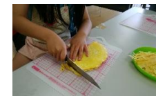
細く切って錦糸たまごに!