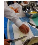
目が、目が〜(玉ねぎを切って)