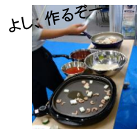
エビやイカを炒めて...

参加者は子ども5名(男子4名、女子1名)と支援員3名。シーフードパエリアとカレーパエリア。具材を入れたら蓋をして20分ほど炊きます。完成するまでランプ大会。炊き上がりを楽しみにしながらゲームをして待つ。ワクワクしながらお腹を空かせて、見事米5合のパエリアを完食でした。次回は6月25日『ロールキャベツ♪』