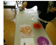
塩コショウで肉に下味