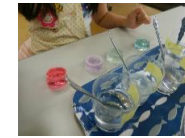
酸には赤っぽく、アルカリには青っぽく反応してます(キレイ!)