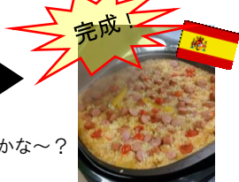
スペインの風が届いてきそう!

これからまなぶーすを利用しようと考えている方に、活動の様子や学びをサポートする子ども支援員、学習ボランティアさんの声をお届けします。◎まなぶーすの利用は無料です。