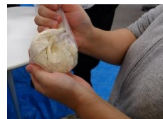
私の分をモミモミ♪↑

親子丼とゼリーの写真がないのは…それどこではなかったのです(´_c_`)ちゃんと親子丼もカラフルなゼリーも作ったのですが…反省m(____;)m