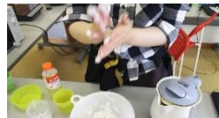
せんせー！耳たぶ位の硬さってどのくらいー??

参加は男子2名、女子1名。こどもの日が近いこともありお団子づくり。まずはみたらし団子とおしるこに挑戦。ひたすら粉を耳たぶくらいの固さになるまでまぜ・まぜ。。みんな触りながらよくわからな〜いと言いながら混ぜ続けました！タレも手作り。きれいな白玉だったり、すいとんみたいな形の白玉だったり、色んな形ができました。そのあと大福づくり。作ってくれた子の手つきがまさかの職人級！意外な才能を発見！(笑)あんこもたっぷりとても美味しくできました。3種の団子パーティーは、鬼退治に行ける勢い(?)で美味しくできた〜♪(・ω・´)9 食べ過ぎて団子っ腹になりましたゞ(;;→⊗←)/