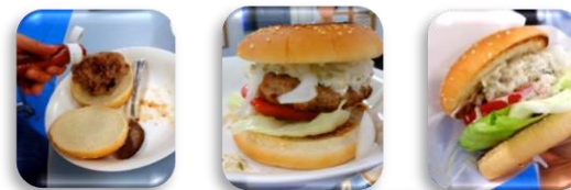
トッピングも食べ方もフリースタイル