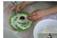
あんこがはみ出ないように包んで成形