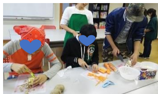
男子チームのシチュー

小学生1名、中学生6名が参加。男子はシチュー、女子はケーキと分担。野菜を切ったり、枝豆をむいたり、シチュー作りに詳しい子どもから、ルーを入れるタイミングまで厳しい指導のもと調理し、具沢山とど〜っても美味しくできました。ケーキの生クリームは、電動ミキサーを区役所前教室から持参するのを忘れ、泡立て器で交代しながらツノが立てまで奮闘しました(・ω・´)結構な力作になりました。