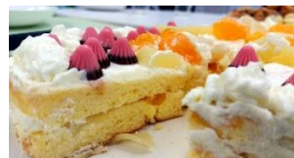
今回の参加人数なら、2つのケーキも即完売！

たらこパスタのソースもちゃんと作ったけれど、証拠写真を撮り忘れちゃった(・ω・´)