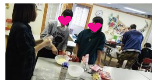
どれもとってもかわいく仕上がりました♪