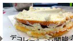
デコレーション開始♪