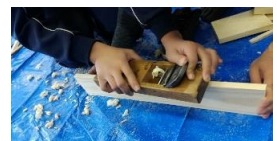
チョークを入れる木箱も手作り。のこぎりやカンナ、インパクトドライバーを使って作りました