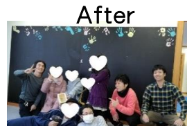
完成〜！みんなで記念撮影