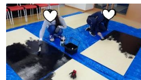
黒板用塗料をひたすら塗ります