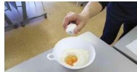
卵は片手で割れます♪

小学生男子1名のみ参加。“ちょっとおなが空いたときに自分で簡単に作れるおやつ”がテーマ。いつも途中参加の彼は、最初から全部作らないといけないことに「え～(・_・)！」と言いつつ、嫌々手伝いながら、「俺、家では手伝いするんだよ」と牛乳の分量を計ったり生地を混ぜたり、「うまいだろ～」と上手に包丁を使いこなしていました。トッピングも楽しみながら、一口頬張った途端「うんま～い(*´д`*)」片づけもすっかりして、日頃の手伝いの成果か、最後までテキパキこなしてくれました(´▽`)次回からはちらし寿司