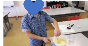
材料を混ぜて焼きます