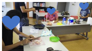
まずはみんなで具材のカット

男子4名(中3:3名、小6:1名)が参加。今回は子ども支援員も男性で初の男子ごはん。用意したベーコン、玉ねぎ2玉をダイナミックにカットし、一度に炒めようとしたため、危うくただの野菜炒めになるところでした。玉ねぎ…多すぎた(´ω`): 卵を卵黄と卵白に分ける作業も上手にできました。味は…子ども支援員は満足でしたが、子ども達には味が薄かったようです。食後は砕いたチョコチップクッキーとバニラアイス混ぜ合わせた、オリジナル(?)アイスを食べ、残った材料でもう一品パスタを作る料理男子もいました。片付け終了後は小学生vs中学生で卓球♪学校も学年も違うけれど、居場所や食事づくりでわいわい楽しそうに過ごす様子は、普段の学習の日には見られない光景で、子ども支援員の楽しみの一つでもあります。来月はお好み焼きパーティーの予定です。