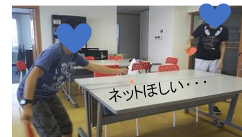
西台教室では人気の卓球♪