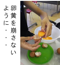
よ卵黄にを崩さない