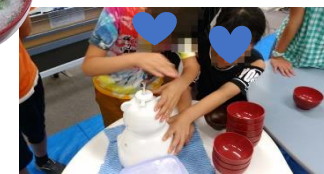
大人気！メロンとイチゴ味