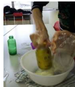
ペットボトルや缶の底で餅つき