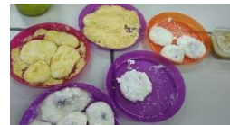
きなこ・あんこ・醤油・からみ餅の完成です!