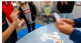
真剣勝負のババ抜き (๑´▽`๑)㊗

小学生5名、中学生2名が参加。お鍋です。「何鍋がいい?」と聞くと決めて「キムチ鍋!」と即答する子ども達。調理に入る前に野菜を切る担当、洗い物担当、メの麺担当を決めるため、ババ抜き大会からスタート(｡◕ˇ◕｡)㊗洗い物担当を逃れるため、1ゲーム20分もかけて大騒ぎで大盛り上がりの勝負。洗い物担当に決まった小学生の男子は、みんなが切り終わったまな板とボールをせっせと洗って、今回のMVPとして拍手喝采でした。鍋はスープ担当の女子2名が甘党で、こっそり2種類の鍋が完成...。するとキムチ鍋を希望したわりに甘口鍋の方が人気に(´_`;)メのラーメンは中1男子2名がほぼ3人前を食べ切り終了。2月は都立入試直前のため、食事は学習の時間前に簡単なおやつ作りです。